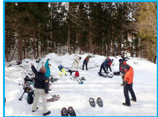
登り始める前には、 しっかりと準備体操！