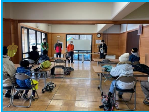
開会式です。講師を紹介！ 頼もしい山や鳥のプロの方々です！