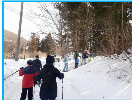
定義古道の入口です。装備を確認 後、いざ雪林の中へ出発！