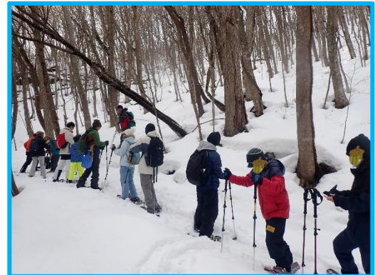
慣れるまで、こまめに休憩をとりな がら、ゆっくりと登っていきます。