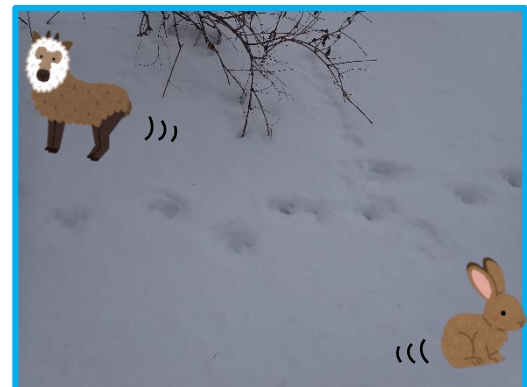
ウサギやカモシカなどの動物の足跡 をたくさん観察できました！